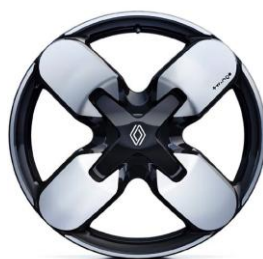
Ζάντες αλουμινίου 18" "mikado"