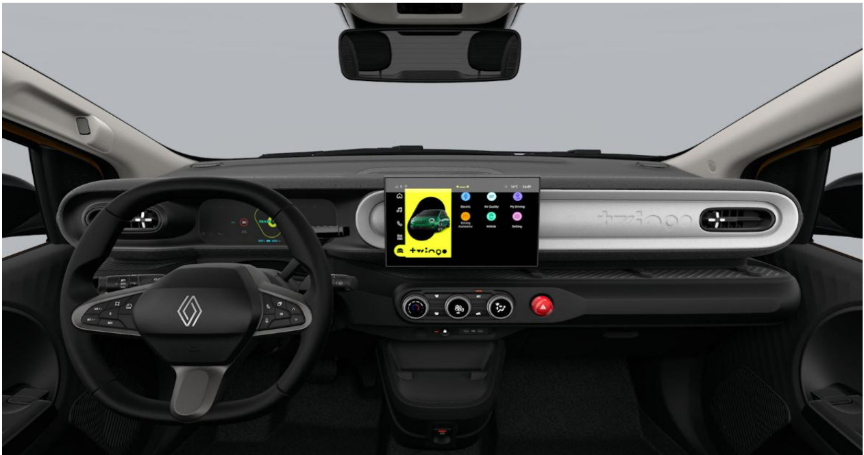
Ψηφιακός πίνακας οργάνων 7" & Σύστημα πολυμέσων openR link 10,1"