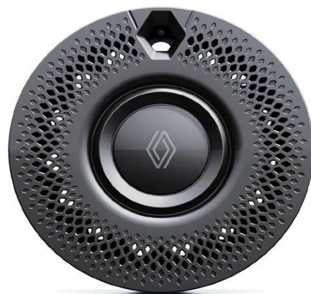
Τροχοί 16" "domino" με μονόχρωμο κάλυμμα