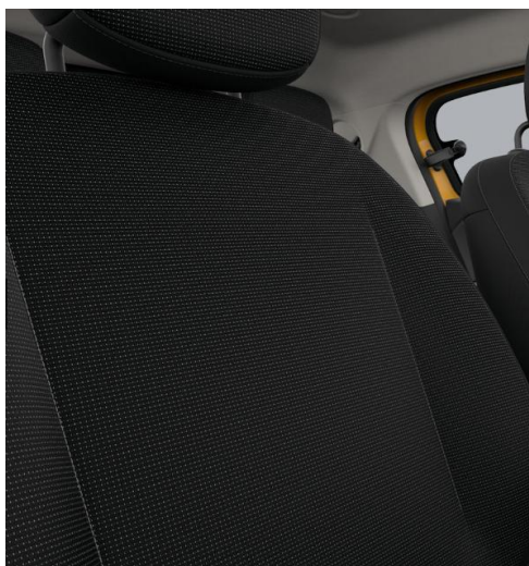
Υφασμάτινες επενδύσεις εμπρός καθισμάτων σε μαύρο χρώμα με λευκά διακοσμητικά στοιχεία & διακοσμητικές ραφές σε ανοιχτό γκρι χρώμα