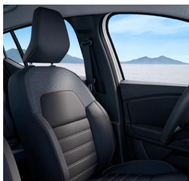
Υφασμάτινες επενδύσεις καθισμάτων