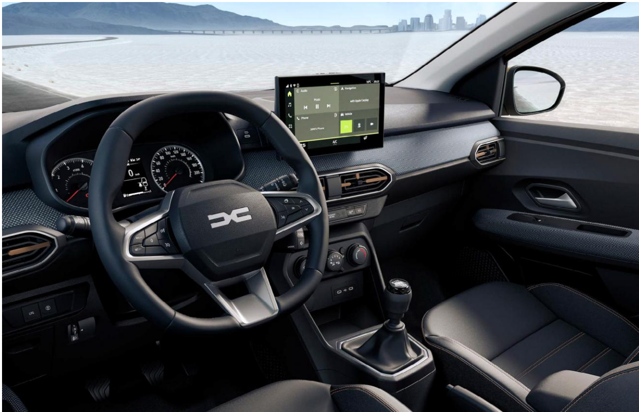
Ψηφιακός πίνακας οργάνων 3,5" & Σύστημα πολυμέσων Media Display 10,1"