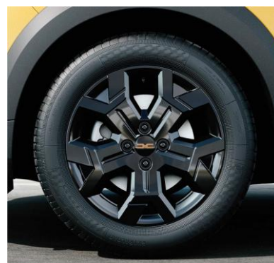
Τροχί 16" & ελαστικά 205/60 R16