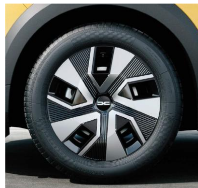
Τροχοί 16" & ελαστικά 205/60 R16