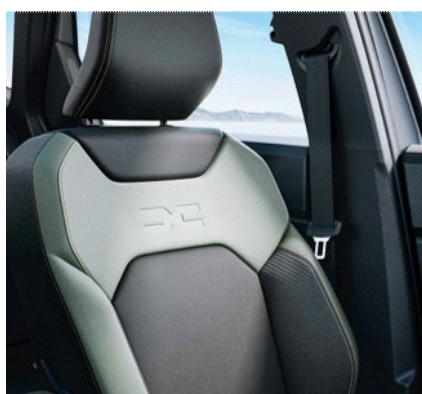
Επενδύσεις καθισμάτων σε τεχνητό δέρμα TER "MicroCloud", σε μαύρο & χακί χρώμα