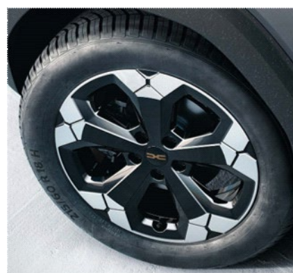
Ζάντες αλουμινίου 18" "tagasan" semi diamond cut