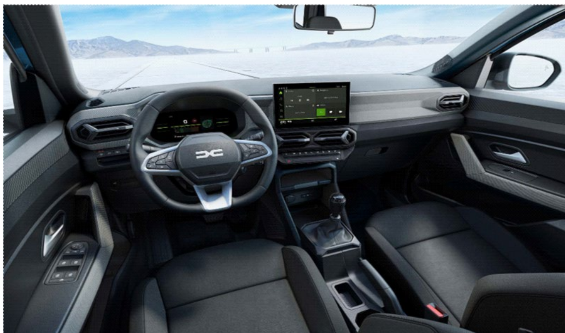
Ψηφιακός πίνακας οργάνων 7" & Σύστημα πολυμέσων Media Display 10,1"