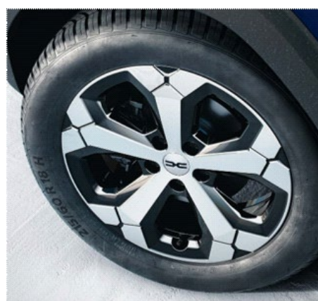
Ζάντες αλουμινίου 18" "tagasan" full diamond cut