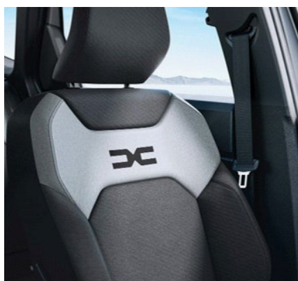
Υφασμάτινες επενδύσεις καθισμάτων σε μαύρο & γκρι χρώμα