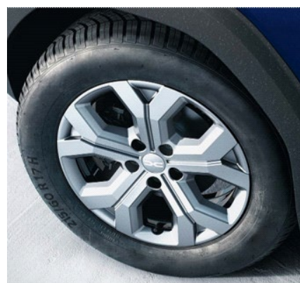
Ζάντες αλουμινίου 17" "tergan"