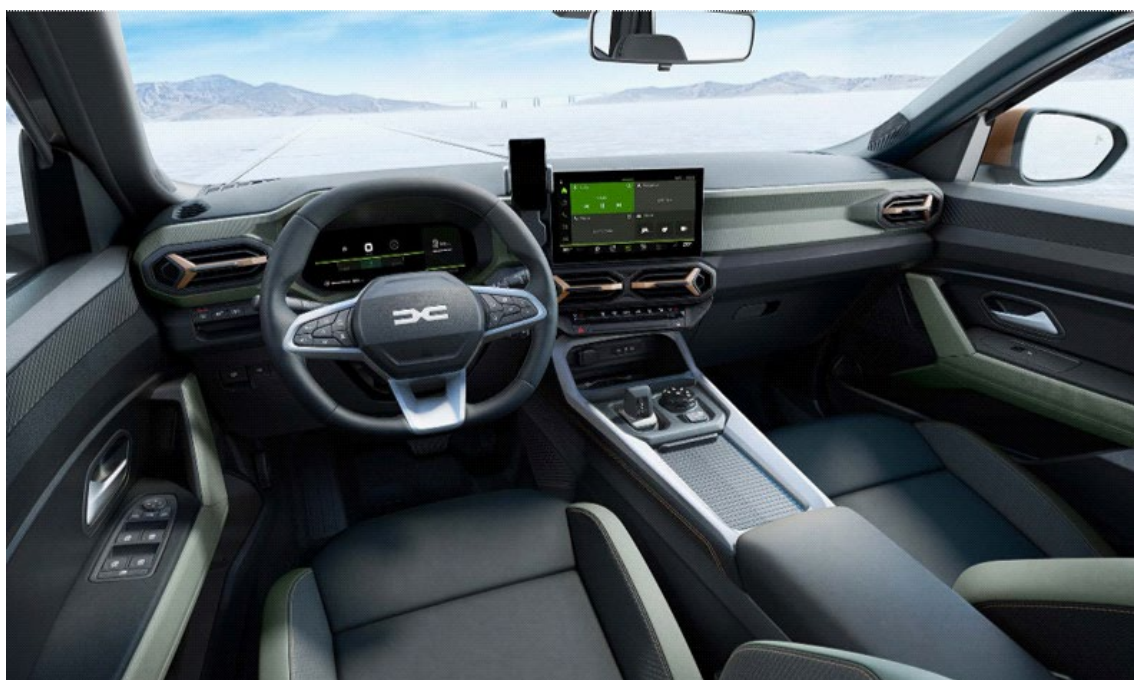
Ψηφιακός πίνακας οργάνων 10,3" & Σύστημα πολυμέσων Media Nav Live 10,1"