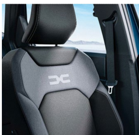
Υφασμάτινες επενδύσεις καθισμάτων σε μαύρο & μπλε χρώμα