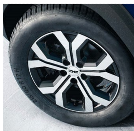
Ζάντες αλουμινίου 17" "tergan" full diamond cut