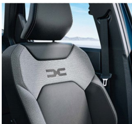
Υφασμάτινες επενδύσεις καθισμάτων σε μαύρο & σκούρο γκρι χρώμα