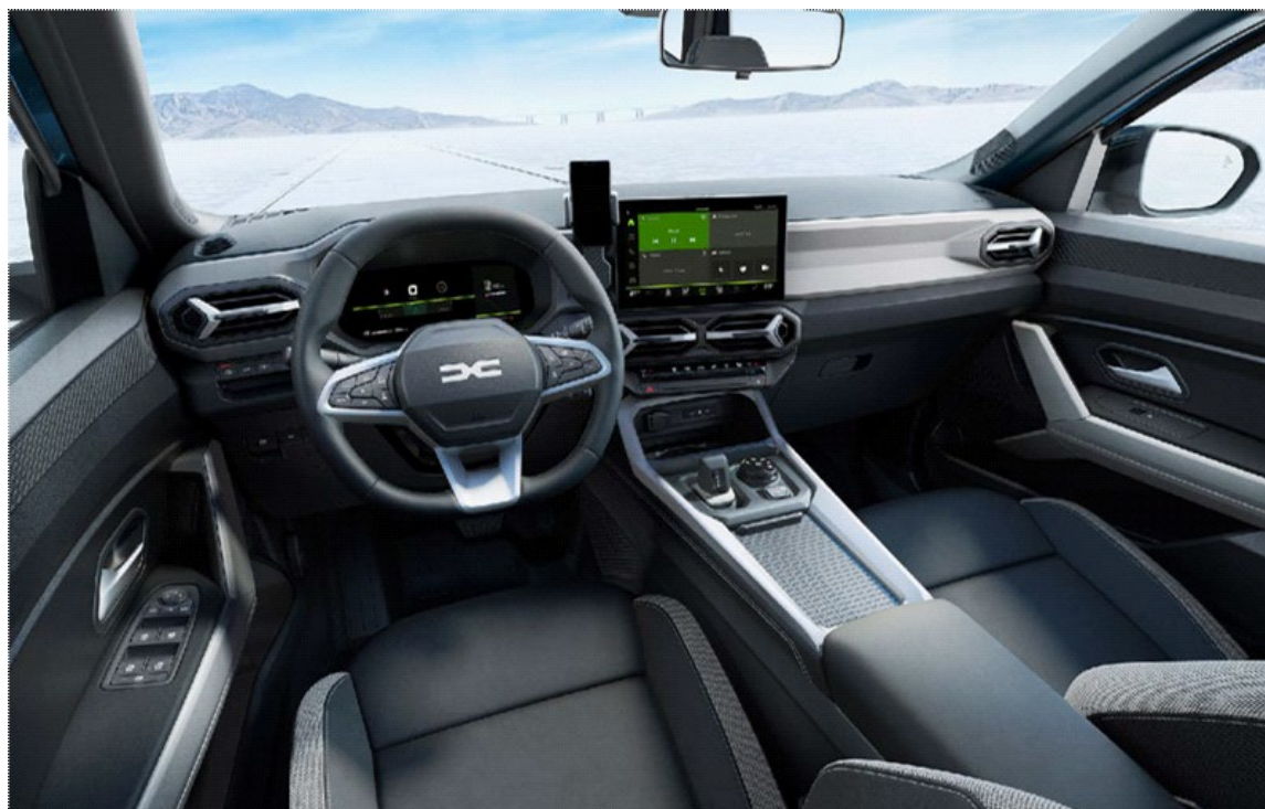
Ψηφιακός πίνακας οργάνων 10,3" & Σύστημα πολυμέσων Media Nav Live 10,1"