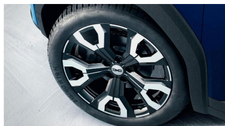
Ζάντες αλουμινίου 19" "rasan" semi diamond cut