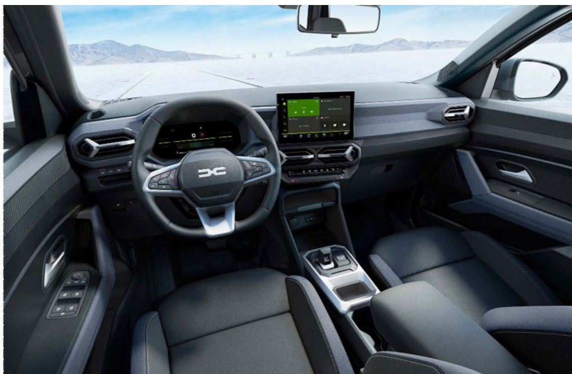
Ψηφιακός πίνακας οργάνων 7" & Σύστημα πολυμέσων Media Display 10,1"