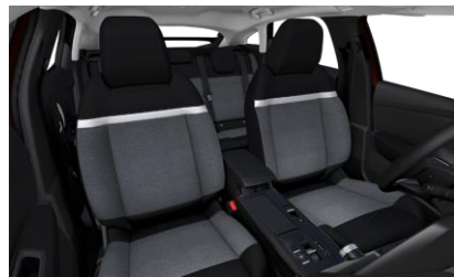
Ambiance Urban Grey: Υφασματινή Επένδυση Chevron Γκρι / Εφέ Μαυρού Δερματός (TEP)