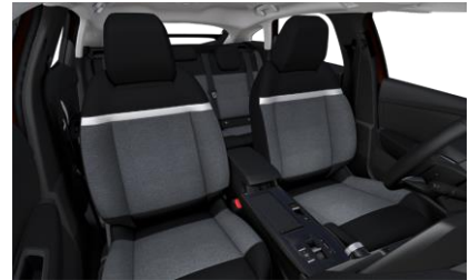
Ambiance Urban Grey: Υφασματινή Επένδυση Chevron Γκρι / Εφέ Μαυρού Δερματός (TEP)